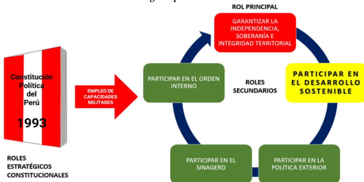
Figura 6 Roles estratégicos para el desarrollo social

cartográfica y de reconocimiento esencial. Estos datos son la base para una planificación territorial ordenada, la gestión eficiente de recursos, el desarrollo de proyectos de infraestructura bien concebidos y la promoción de sectores como el turismo (LBDN, 2006).